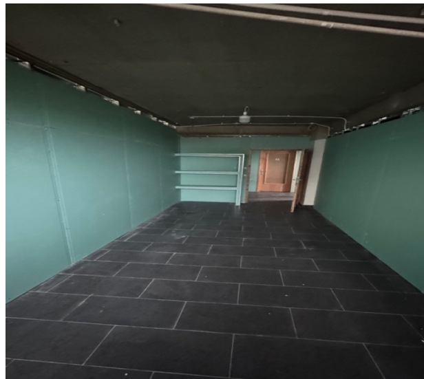
Une chambre d'accueil avec étagère