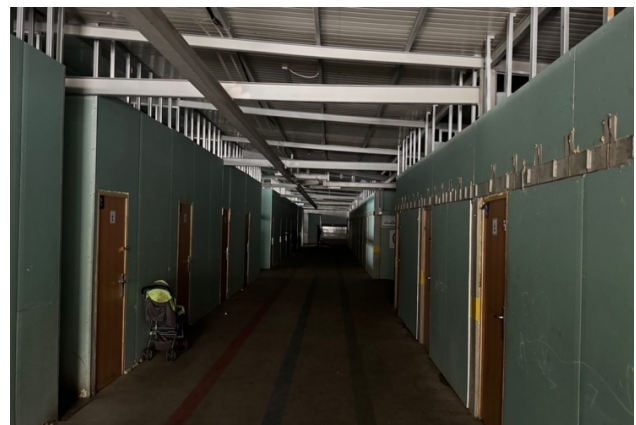
Les couloirs entre les logements