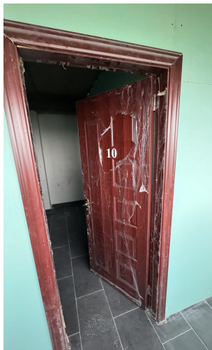
Porte n° 10 — sécurité retrouvée, dignité préservée