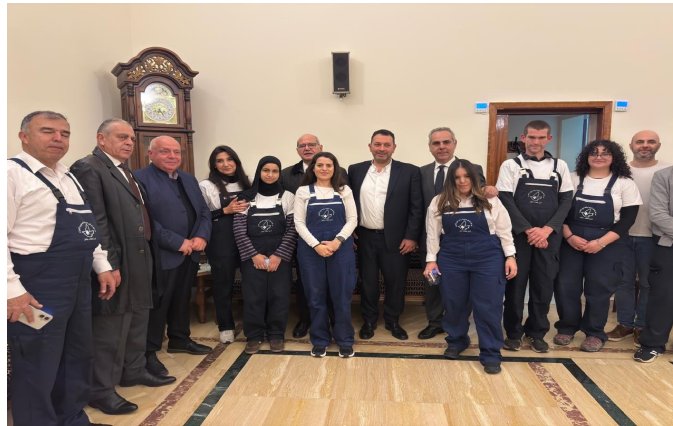
L'équipe de bénévoles OffreJoie — cheville ouvrière de l'ensemble du projet · Beyrouth, mars 2026