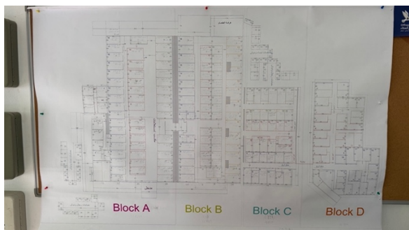
La disposition des blocks de logements

Des enseignants bénévoles ont mis en place un dispositif de scolarisation sur site, afin que les enfants hébergés ne soient pas privés de leur droit fondamental à l'éducation. Parce que la guerre ne devait pas voler l'avenir d'une génération.