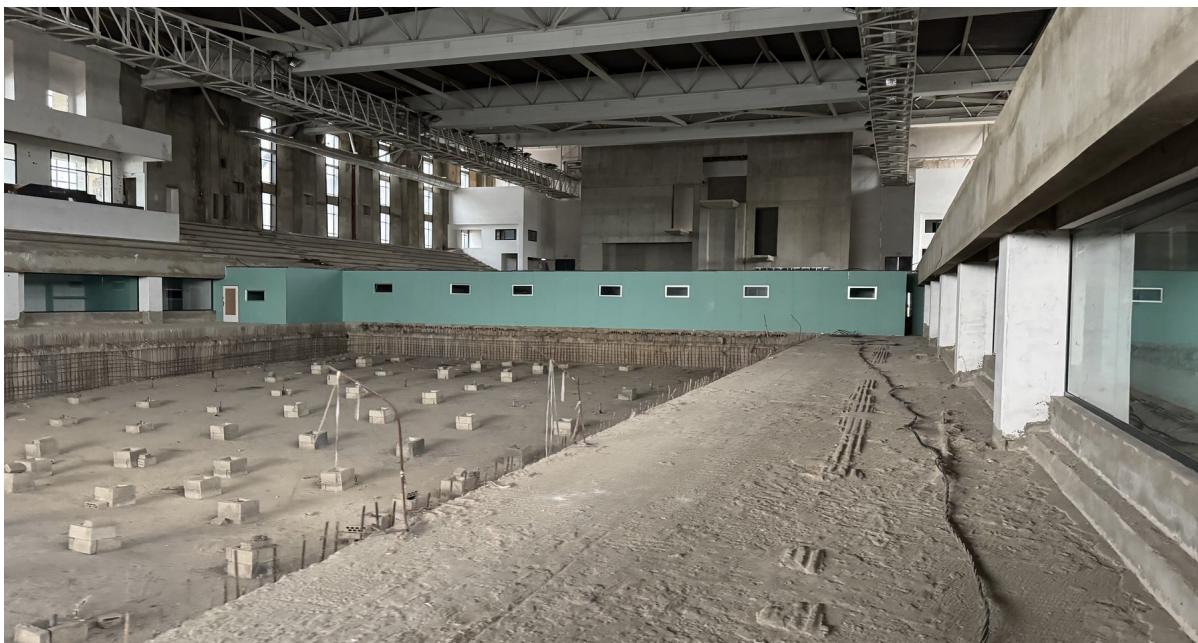
La piscine olympique en réhabilitation