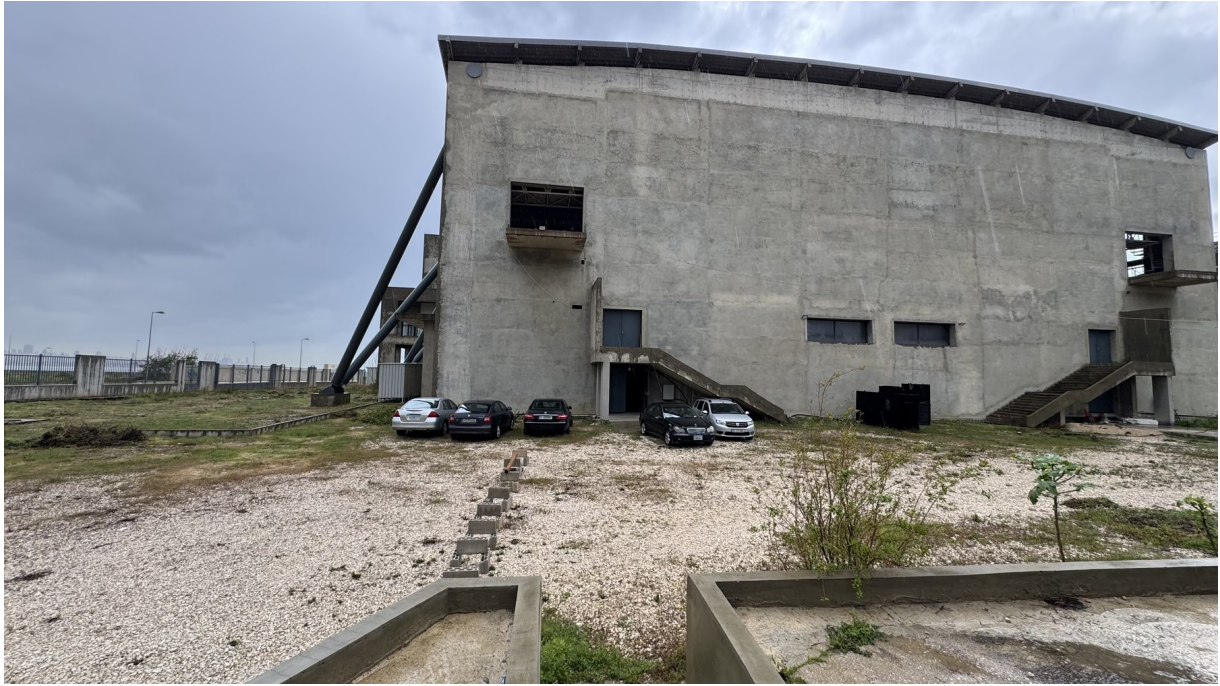
Le complexe olympique de Beyrouth Mars 2026

Association loi 1901 · SIREN 389 141 953 · Partenaire OffreJoie Liban